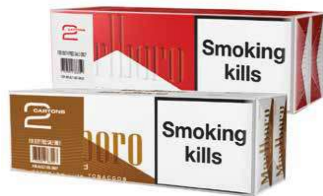
MARLBORO BOX/GOLD ORIGINAL 400 cigarettes (Lot de 2 cartouches)