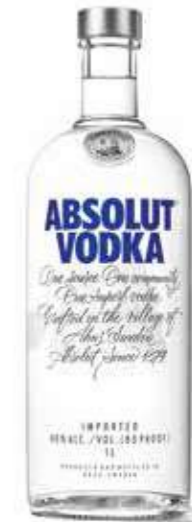
VODKA ABSOLUT Blue 1 L