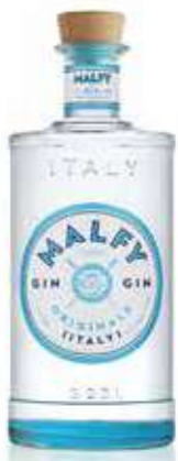
MALFY GIN ORIGINALE 1L