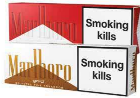
MARLBORO BOX/GOLD ORIGINAL 200 cigarettes (1 cartouche)