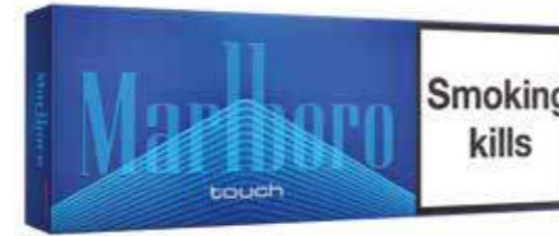
MARLBORO TOUCH 200 cigarettes (1 cartouche)