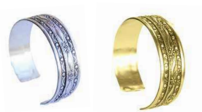
1 BRACELET KROUMIR

1 Bracelet traditionnel tunisien en métal argenté ou en plaqué or.