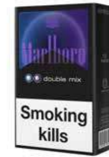
MARLBORO DOUBLE MIX 200 cigarettes (1 cartouche)