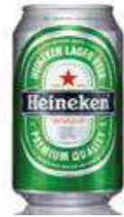
BIÈRE HEINEKEN 33 cl