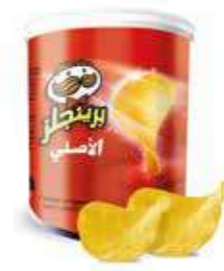
CHIPS PRINGLES ORIGINAL 40 gr