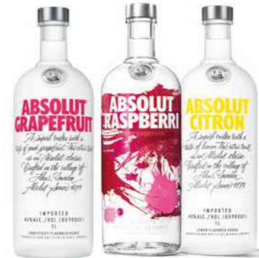
VODKA ABSOLUT Grapefruit 1 L - Raspberri 1 L - Citron 1 L