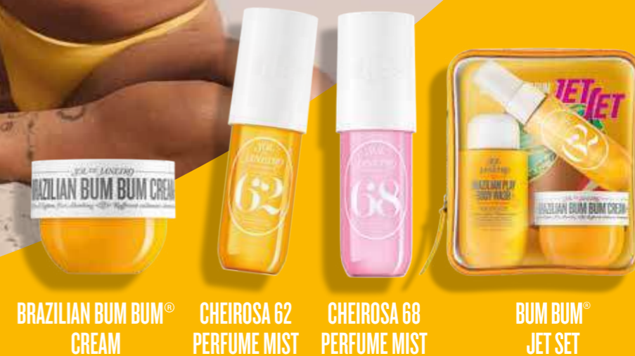
BRAZILIAN BUM BUM® CREAM