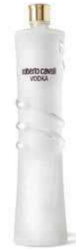
VODKA ROBERTO CAVALLI 1 L