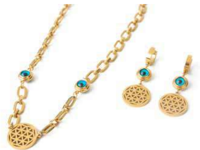
SET COLLIER ET BOUCLES D'OREILLE EN MÉTAL DORÉ NECKLACE AND EARRINGS SET IN GOLD TONE METAL