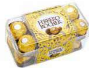
FERRERO ROCHER 16 pièces