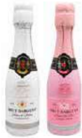
VIN MOUSSEUX Blanc chardonnay /Rosé Pinot noir 20 cl