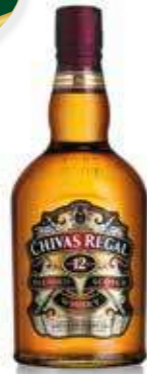
CHIVAS REGAL 1L