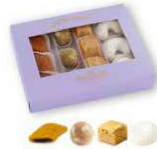
COFFRET MASMOUDI 205 gr (12 pièces)