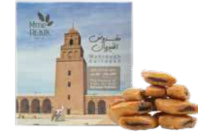
MAKROUDH MME REKIK 250 gr