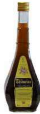
CARAFE THIBARINE Liqueur Digestive Digesting liquor 75 cl