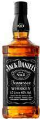
JACK DANIEL'S 1 L