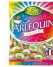
ARLEQUIN 150 gr