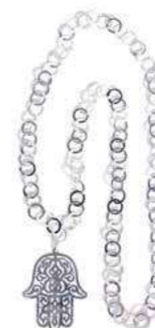
COLLIER «RIHANA» EN MÉTAL ARGENTÉ SILVER TONE «RIHANA» NECKLACE