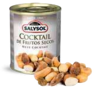
COCKTAIL DE FRUITS SECS 90 gr