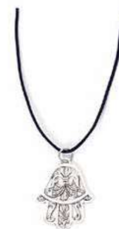
COLLIER «MAIN DE FATMA» CORDON NOIR + PENDANTIF EN MÉTAL ARGENTÉ SILVER TONE «MAIN DE FATMA» PENDANT ON BLACK CORD