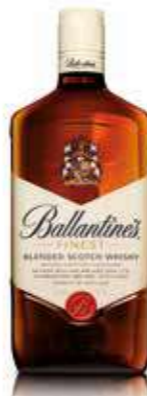
BALLANTINES 1 L