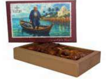
COFFRET DATTES TAZART 500 gr