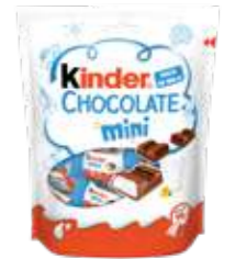
KINDER MINI CHOCOLATE 120 gr