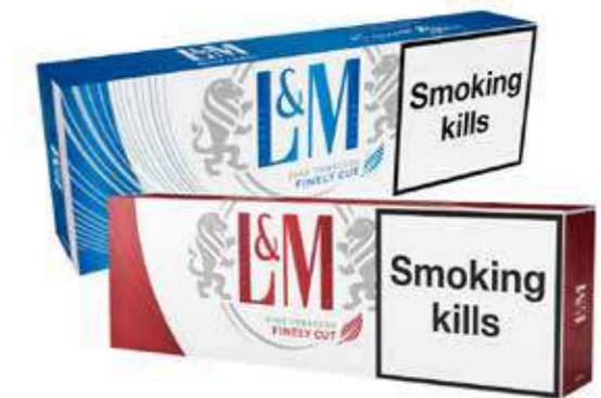
L&M RED LABEL/BLUE LABEL 200 cigarettes (1 cartouche)